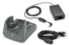
Support simple pour Ethernet et recharge