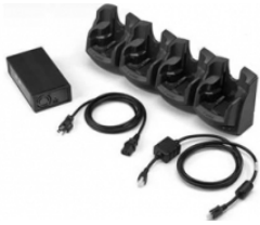
Support à fentes pour Ethernet et recharge